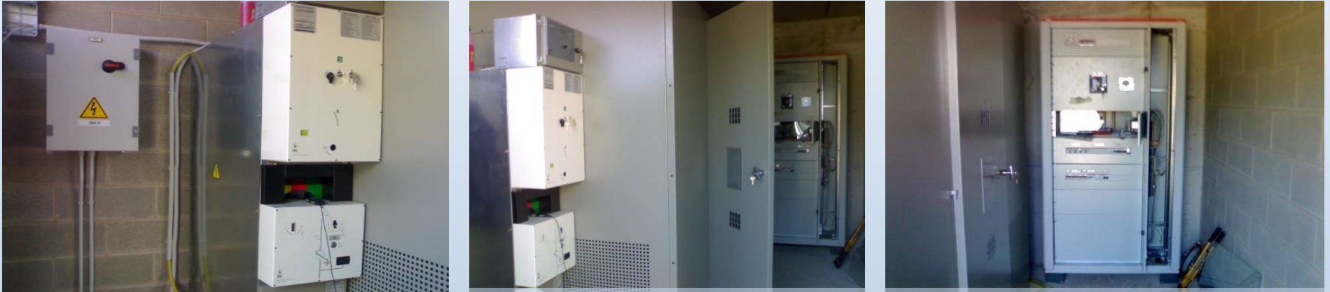
Montaggio cabina in MT-BT “ IPERSTANDA ” Cisano Bergamasco (BG) Anno 2008