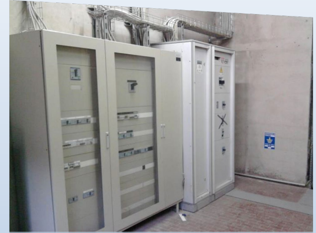
Impianto verniciatura automatica per motori Iveco. Anno 2012