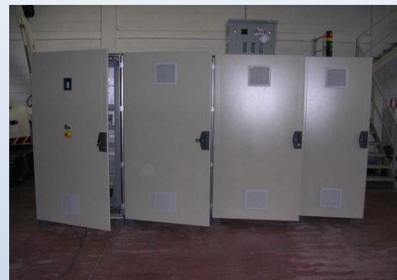
Quadro di comando e gestione per cesoia automatizzata Anno 2014