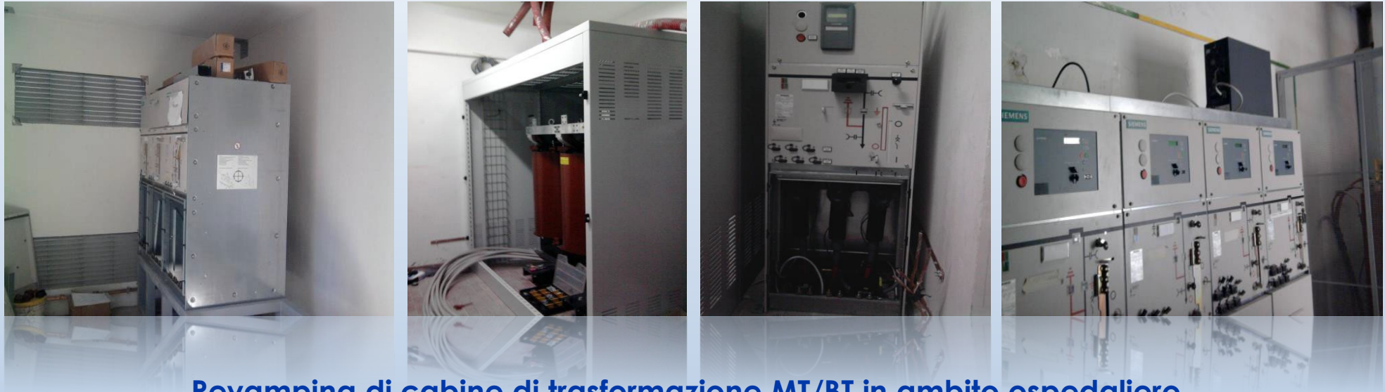
Revamping di cabine di trasformazione MT/BT in ambito ospedaliero Anno 2010