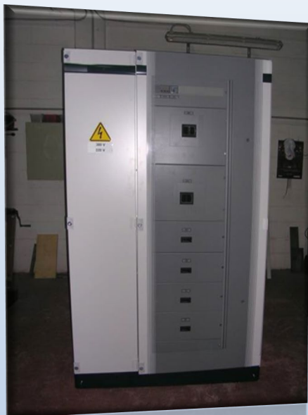
Quadro distribuzione primaria cabina da 400kva Anno 2013